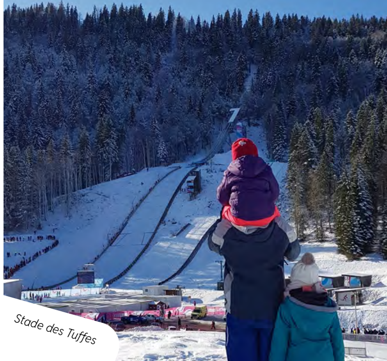
Stade des Tuffes