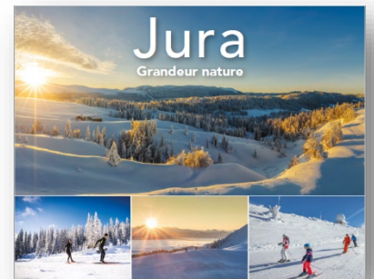
Magazine Jura hiver

Visible sur ce lien : https://www.jura-tourism.com/essentiel-du-jura/pratique/carte-brochures-et-guides/jura-hiver/