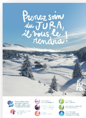
Affiche adoptez les bons réflexes