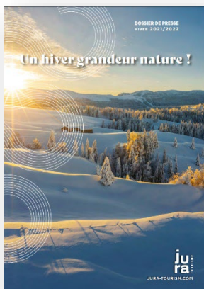
Dossier de presse