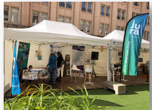
Salon Grand Bivouac