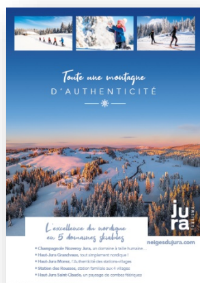
Pub Nordic Mag et Biathlon Mag